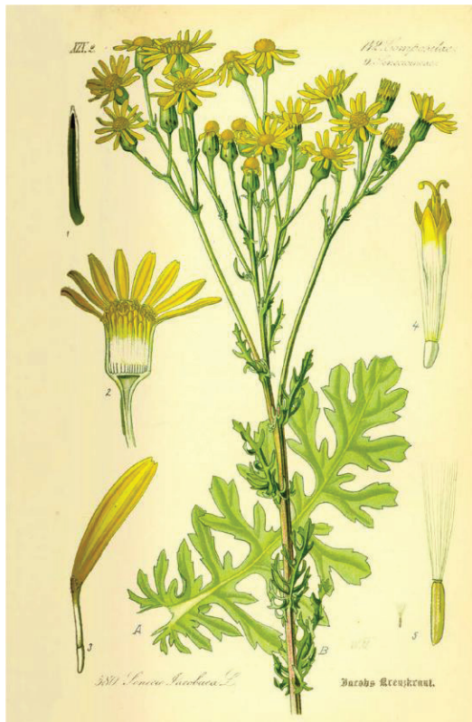
Abbildung 1 Jakobs-Kreuzkraut, Bildertafel aus Thome (1885) www.BioLib.de