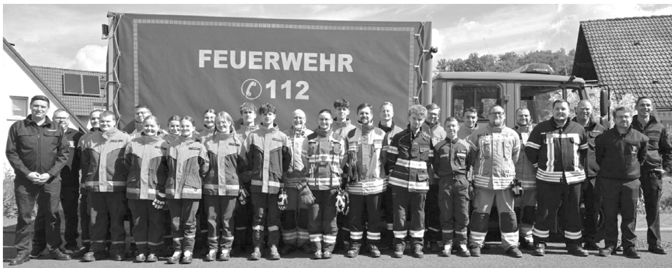
alle Teilnehmer aus dem Bereich 3/2