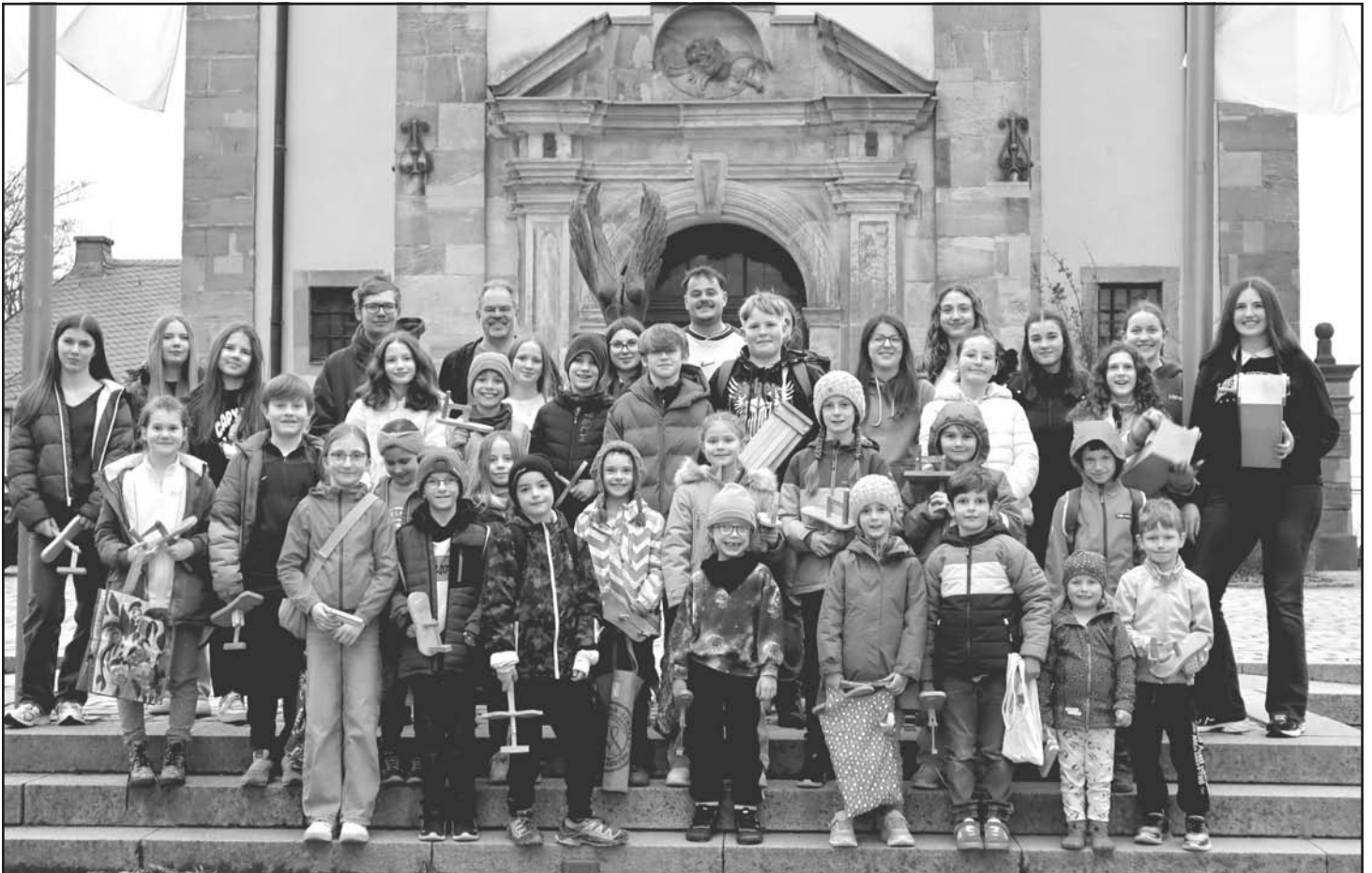
Gruppenfoto nach zwei »Klappertagen«