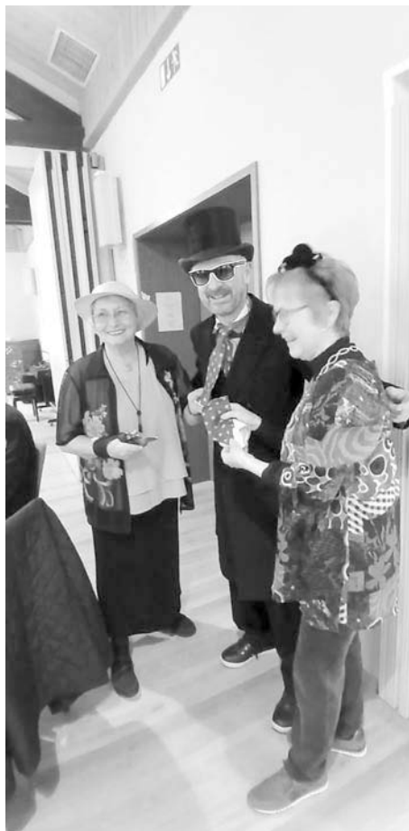
(Text: R. Imhof)