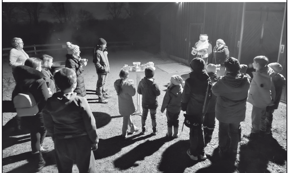
(Text u. Bild: Jochen Muckenschnabl, 1. Kommandant FF Johannesberg)