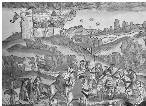
Bild aus der sehenswerten Ausstellung zum 500. Jahrestag des Bauernkrieges 1525