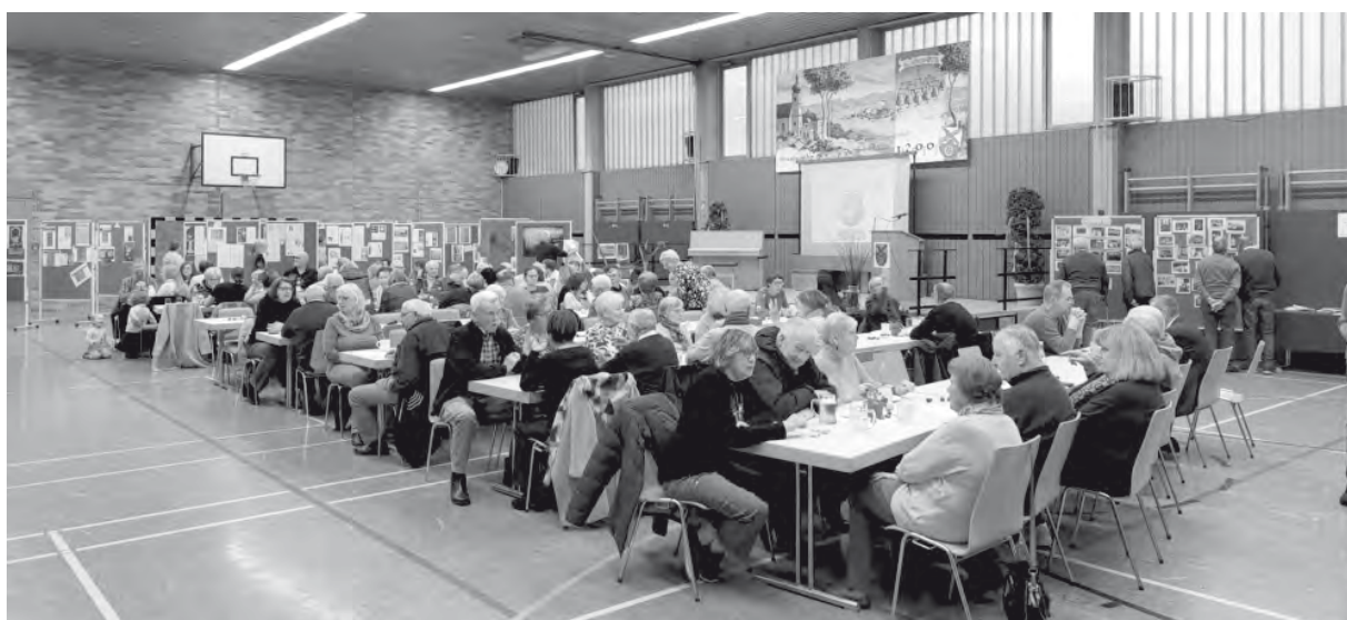
Guter Besuch nach dem Friedhofsgang zu »Allerheiligen«