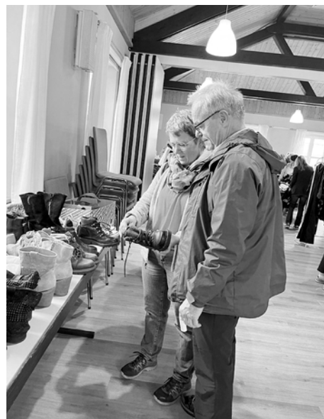
(Text und Bilder: Ellen Specht, Pia Kraus / Gemeinsam Grün-laudato si Johannesburg)