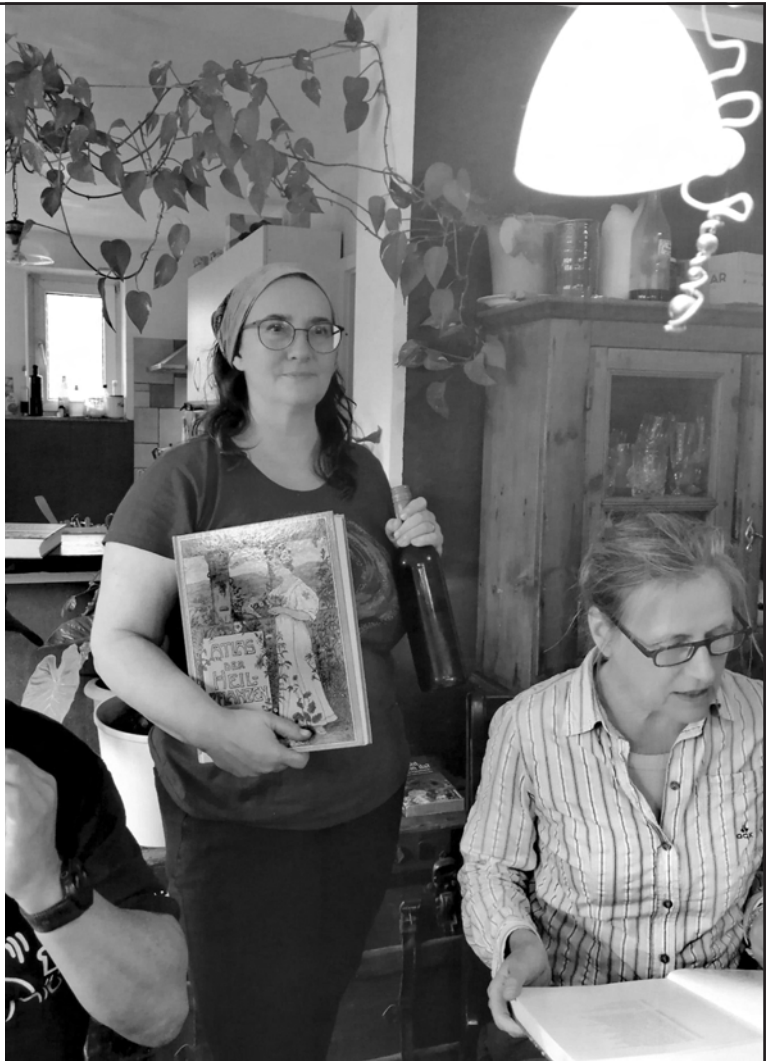
(Text und Bild: Ellen Specht, Gemeinsam Grün Johannesberg)

Alle waren danach rundum zufrieden und gingen mit vielen Anregungen zum Weitermachen nach Hause. Ein gelungener Tag! Auf Grund der hohen Nachfrage werden in 2026 zwei Termine angedacht, die in der Gemeinsam-Grün-Rubrik rechtzeitig bekannt gegeben werden.