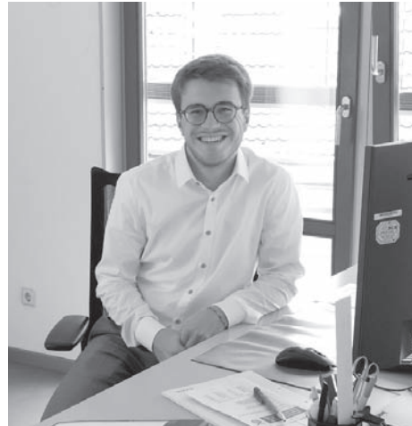
Text und Bilder: Gemeinde Johannesberg