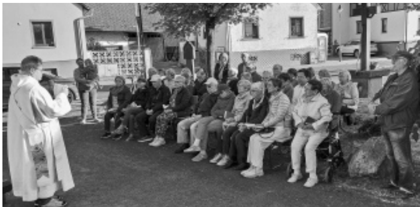
Maiandacht an der Johannesberger Kapelle, ein besonders heraushebendes Gestaltungselement an der geschichtsreichen Einmündung der Breunsberger Straße und in Sichtweite der Pfarrkirche »Sankt Johannes Enthauptung«