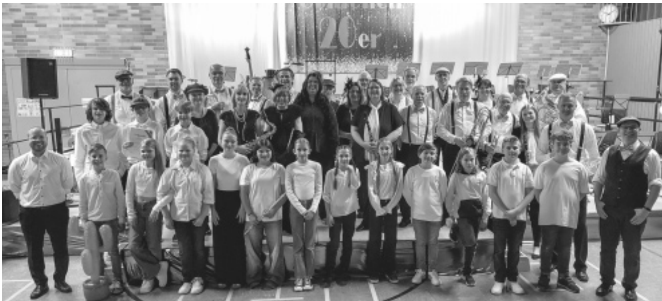
»Die Musikerinnen & Musiker aus Affolderbach« präsentierten eine wunderbare Auswahl an Musik der goldenen Ära.

Passend zum Motto verwandelte das kreative Helferteam die sonst so nüchterne Turnhalle in das Gewand der »Goldenen Zwanziger Jahre«. Mit den verschiedenen Formationen zeigte der Musikverein ebenfalls seine Verwandlungskünste und bot so ein abwechslungsreiches und kurzweiliges Konzertprogramm.