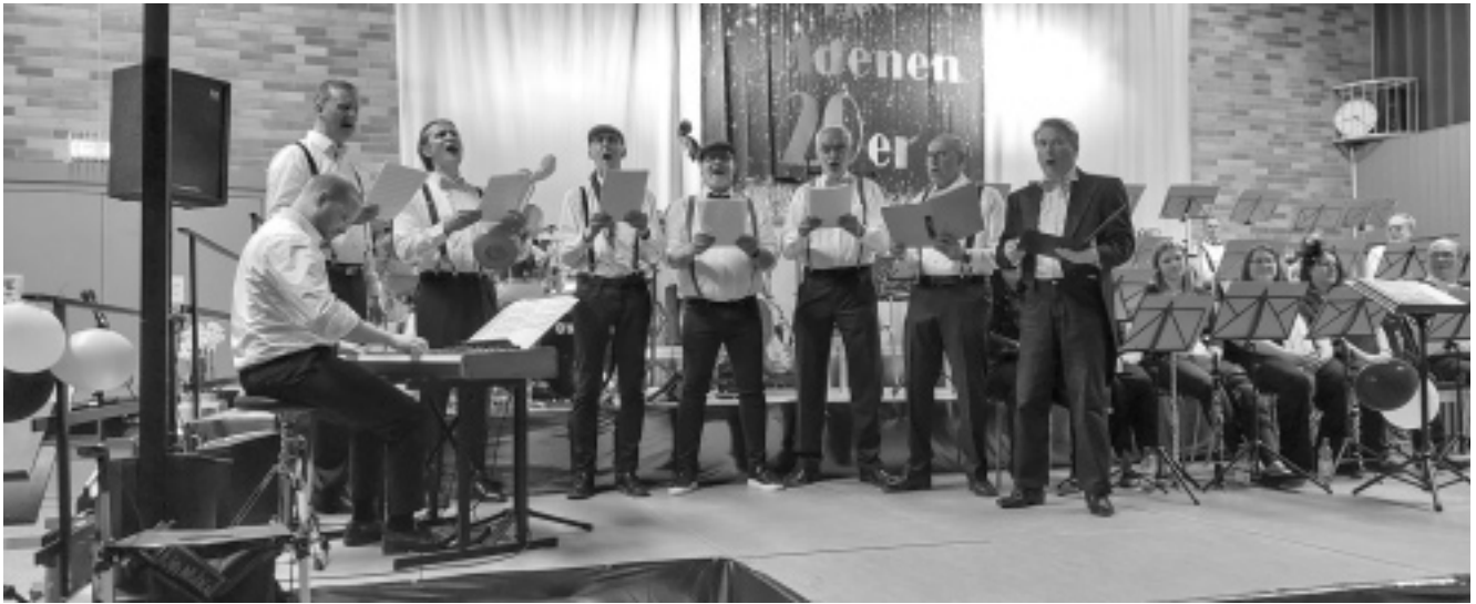
Eine Premiere beim Musikverein Johannesberg, die a capella-Gruppe, »Die MVJ-Acht Zylinder«