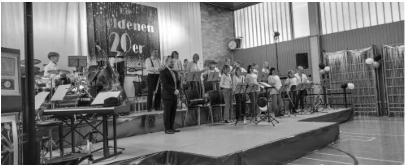
Die motivierten Kinder und Jugendlichen der Jugendkapelle des Musikvereins Johannesberg zeigten einen rundum gelungenen Auftritt.