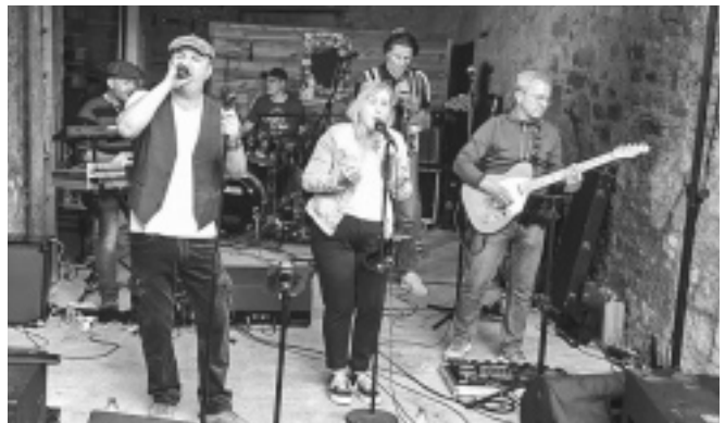
Aus altehrwürdigem Gemäuer erklang modern Fetziges von der Gruppe »Touch-Down«, wozu einige ihr Tanzbein schwingen.