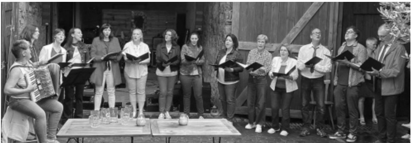
Zum ersten Mal präsentierten sich die Sängerinnen und Sänger »The Generation« beim »Fête de la musique«.