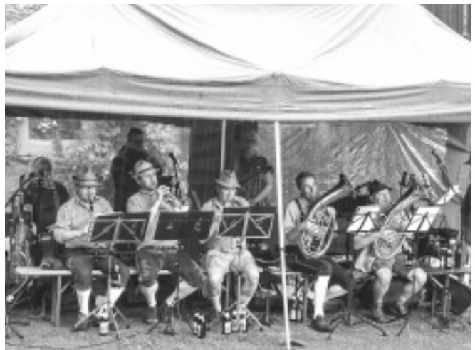
Immer wieder faszinierend, wie anziehend das Fête de la musique wirkt. Die Menschen kamen trotz des Störenfriedes »Wetter«, um zu bleiben. Die »5 Spitzbuben« aus Sailauf