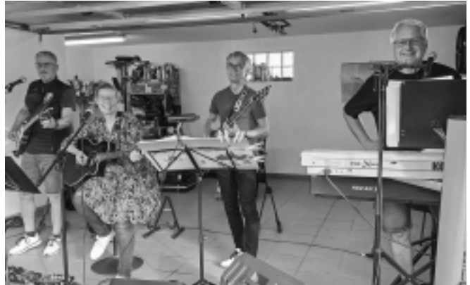
Die Gruppe »Yellow Shoes« sind seit einigen Jahren mit von der Partie.