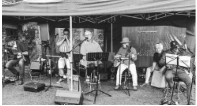
Die Gruppe »Rust never Sleeps«