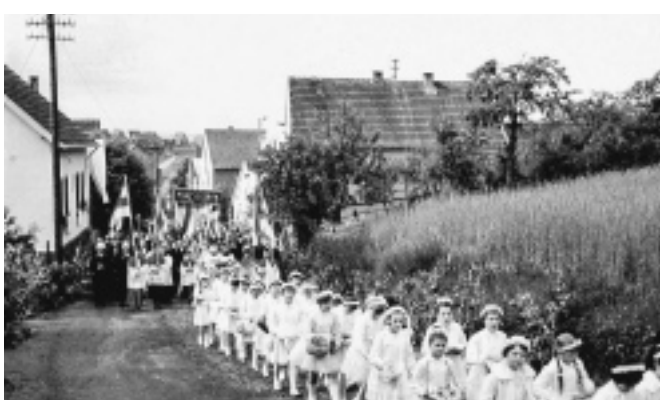
Beeindruckende Teilnahme der Kommunionkinder