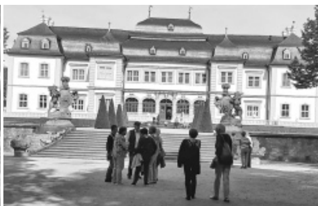
(Text und Bilder: Roswitha Imhof für die Seniorengemeinschaft)