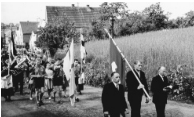
Fronleichnam auf der Oberafferbacher Straße, Höhe des späten Einkaufsgebäudes mit der KAB-Fahnenabordnung und der teilnehmenden Männer im Sonntagsgewand