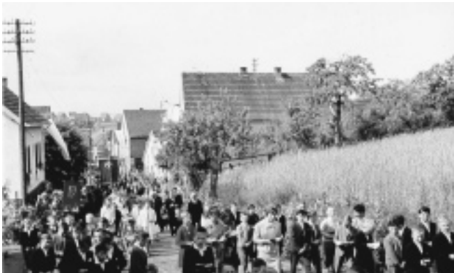
Blick auf die Kommunionbuben, Schulkinder mit den Vorbeterinnen

(Text und Bilder aus dem HGV-Archiv für den Heimat- und Geschichtsverein Johannesberg: Michael Rosner)