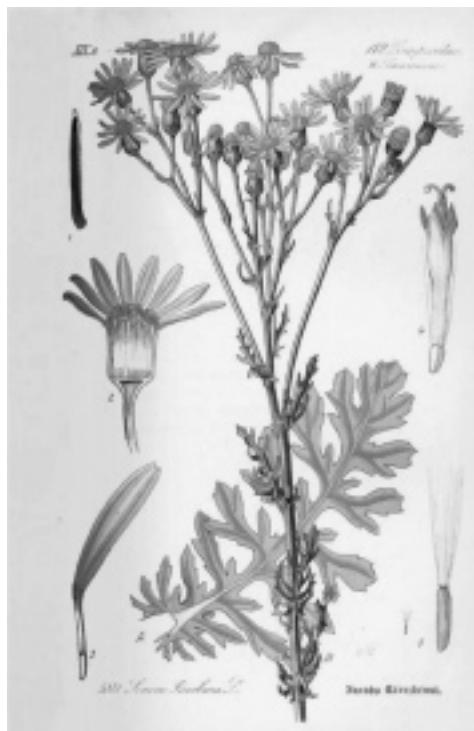
(Text und Bild: Landratsamt Aschaffenburg)