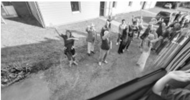
Am Sonntagmorgen hieß es: a bientôt, à l'année prochaine à Johannesberg

(Text und Bilder für das Partnerschaftskomitee: Hildegard und Michael Rosner)