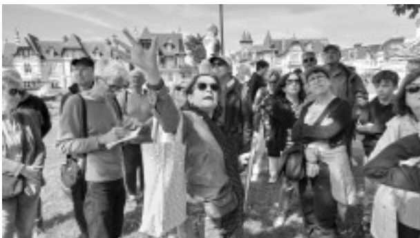
Führung durch Cabourg