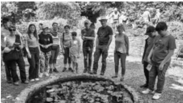
In den Gärten der Pays d'Auge im Dorf »Cambremer«