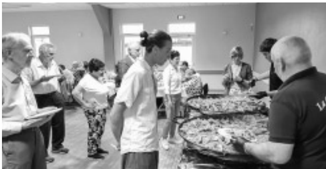
Blick auf die zwei übergroßen Pfannen mit der »Paella«