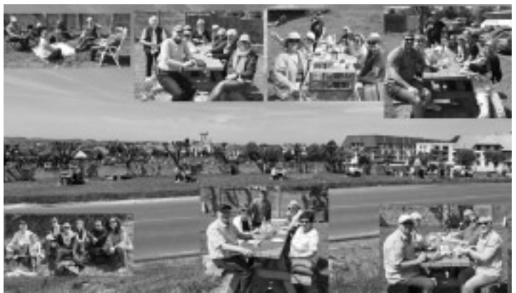
Zwar ohne Meerblick, dafür jedoch mit einem Panorama in die Ewigkeit wurden in Cabourg nahe des Friedhofs die reichlich gefüllten Taschen zum Picknick ausgepackt.