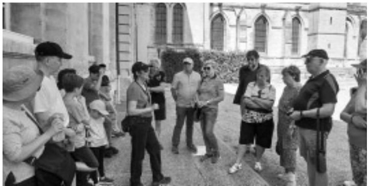
Stadtführung durch Caen, beginnend am Sitz der Präfektur des Départements Calvados