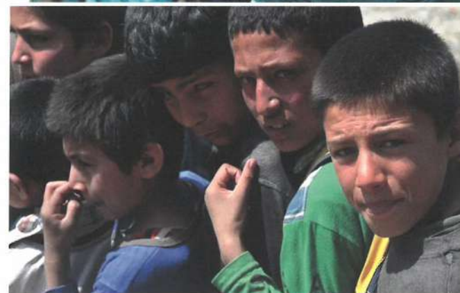
2015 | Deutsch