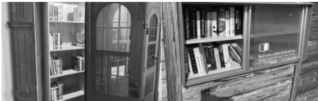
Bücherschrank im alten Beichtstuhl in der Pfarrkirche Johannesberg