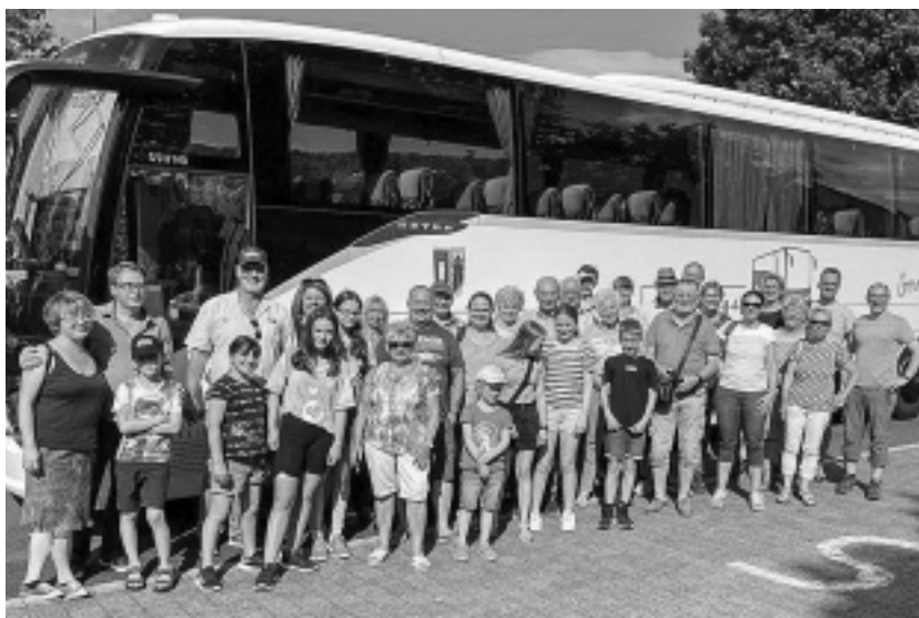
(Text und Bild: Musikverein Johannesberg)

Waren hier die Augen und Ohren ausgiebig auf ihre Kosten gekommen, sollten nun auch die anderen Sinne nicht zu kurz kommen. Nächster Halt Kreuzberg - Mittagsrast war angesagt! Nach dem kurzen Aufstieg zum Biergarten, ließ sich der ein oder die andere als Nahrungsergänzung das kühle dunkle Bräu der Mönche schmecken oder nutzte die Zeit für eine stille Einkehr in die dortige Kirche. Frisch gestärkt nahm die Reisegruppe nun das nächste Ziel ins Visier. Eine wohl treffende Formulierung für eine Reise in die Vergangenheit zur Mahn-, Gedenk- und Bildungsstätte »Point Alpha«. Dieser Beobachtungsstützpunkt aus der Zeit des Eisernen Vorhangs vermittelte mit den noch vorhandenen Wachtürmen und Grenzanlagen einen guten oder besser gesagt erschreckenden Einblick in die Zeit der deutschen Teilung. Die eindrucksvollen Informationen zu diesem damals strategisch so wichtigen Ort stimmten nachdenklich. Nicht nur aufgrund der Mittagshitze von 35° C konnten die Besucher nachempfinden, dass Point Alpha in der Zeit des kalten Krieges ein militärischer Hotspot war. Zurück aus der Vergangenheit sehnte sich die Reisegruppe nach Abkühlung. Passend dazu hatte das »Orga-Team« nun noch eine angenehme Seite der Rhön parat und so ließ man den abwechslungsreichen Tag mit den vielen Eindrücken in geselliger Runde im schönen Städtchen Tann ausklingen, bevor wieder die gemeinsame Heimreise angetreten wurde.