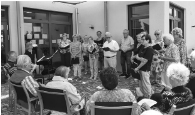
(Für die Chorgemeinschaft Johannesberg: Siegfried Schimpl)

Das Betreuungsteam kredenzte einen kühlen Umtrunk und verband den Dank mit der Bitte, so eine nette Stunde erneut zu wiederholen.