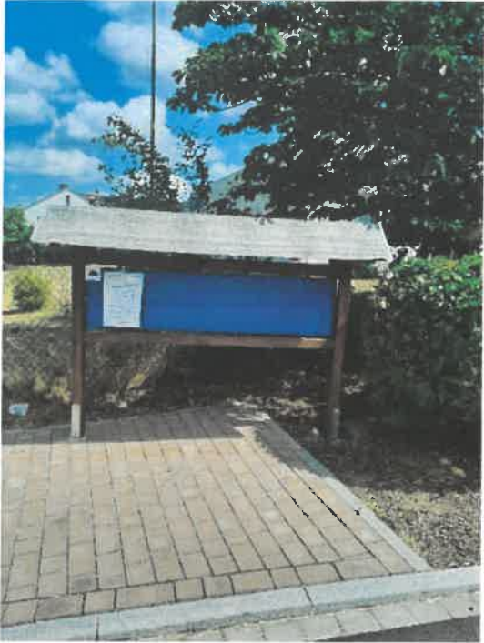
Ortseingang (v. Aschaffenburg kommend)