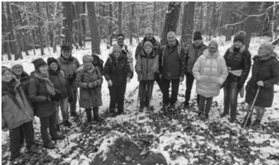
(Text und Bild: Wanderlust Breunsberg)

Ein Highlight der Wanderung am 22.01.2023 auf dem Kulturweg „Spessarter Ur-Pfarrei Oberbessenbach“ war der „Frau Holle Stein“. In Oberbessenbach erzählte man den Kindern, es schneie, wenn Frau Holle an diesem Stein ihre Betten ausschüttelte. Frau Holle schüttelte für unsere Wanderung ordentlich ihre Betten aus, denn wir konnten die 12 km lange Rundwanderung im Schnee laufen. Auf dem Weg mussten wir einige steile An- und Abstiege bewerkstelligen. Der Kulturweg führte uns auch an dem „Keiner-Steinbruch“ vorbei. Der Steinbruch der Firma Alois Keiner war von 1949 bis 1959 in Betrieb und war damals waldfrei. Erstaunlich schnell hat sich der Wald das Gelände wieder zurückerobert. Denn nur durch die blätterlosen Bäume konnten wir einen Blick auf den Steinbruch werfen. Start- und Endpunkt der Wanderung war der Parkplatz auf dem Oberbessenbacher Kirchberg. Auf dem Kirchberg steht neben der Pfarrkirche Sankt Stephanus die sehr alte Ottilienkirche. Im späten Mittelalter war der zur Kirche gehörende Ottilienbrunnen Wallfahrtsort für Pilger, insbesondere bei Augenleiden. Bei gutem Essen und Trinken ließen wir die Wanderung im Gasthaus „Zum weißen Roß“ in Straßbessenbach ausklingen.