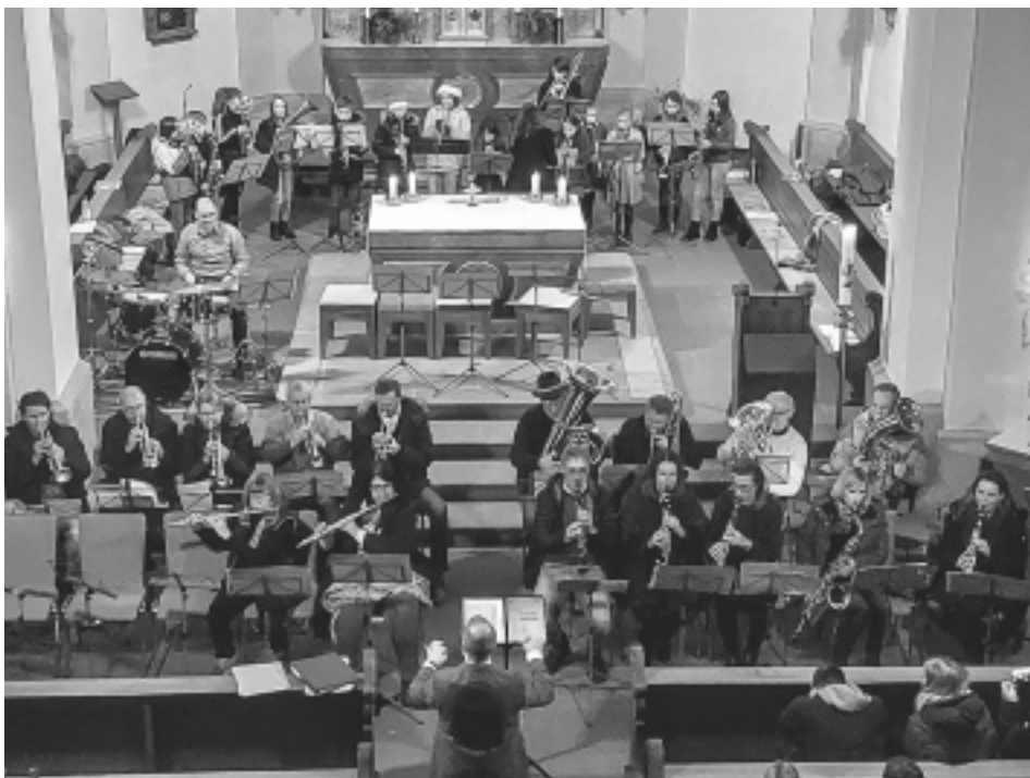
Die Musikantinnen und Musikanten des Musikvereins Johannesberg lassen im Chorraum der Johannesberger Pfarrkirche bekanntes wie auch weniger vertrautes adventliches Liedgut konzertant erklingen.

Dass die leisen wie die laueren Töne sehr einfühlsam gesetzt werden können, beweist in seiner Größe das Gesamtorchester. Mit »Crossing Time«, dem anheimelnden »Maria durch den Dornwald ging«, »White Christmas«, »Frosty the snowman« sowie »Last Christmas« wird auch mit modernerem Liedgut auf die kommende Weihnachtszeit hingeführt. Die mit reichlich Beifall geforderte Zugabe »Leise rieselt der Schnee«, in die alle Musikantinnen und Musikanten einstimmen, war der abschließende adventliche Balsam für ein nicht einfaches 2022.