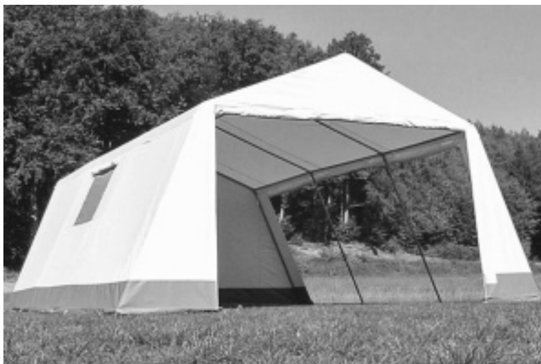
Das neue Essenszelt für die Waldgruppen des Kinderhauses

(Text & Bilder: St. Johannesverein e. V.)