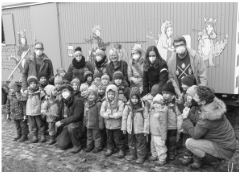
Übergabe des Verkaufserlöses an den Waldkindergarten