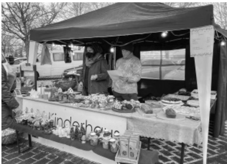
Verkaufsstand der Waldeltern im Advent