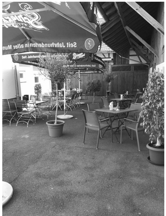
Die Ruhe vor dem Sturm im Biergarten des „MGH zum Lamm“

(Text und Bild: Mehrgenerationenhaus Lebensträume e.V. A. Fuchs)