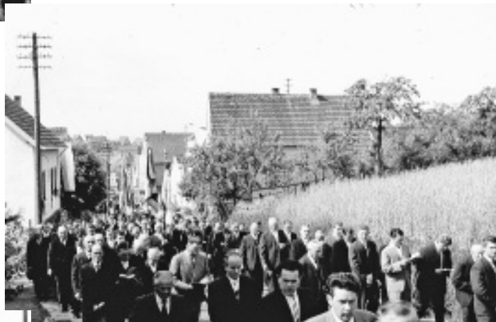
Fronleichnamzug mit dem »Männerteil«; auch aus der damaligen Gemeinde Reichenbach, die zur Pfarrei Johannesberg zählte, haben zudem die Gläubigen aus Breunberg, Rückersbach und Steinbach teilgenommen