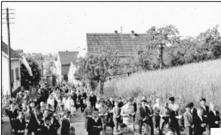
Fronleichnamzug mit Schulkindern und den Vorbeterinnen