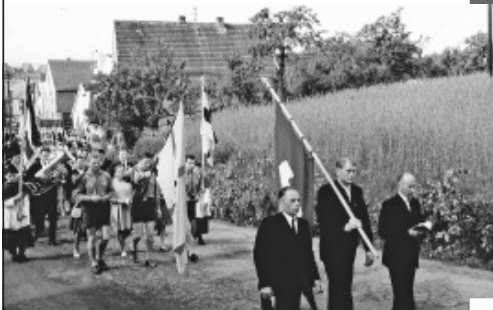
Fahnenabordnungen - vorne der KAB und nachfolgend die Gruppe der Pfadfinder und der Musiker